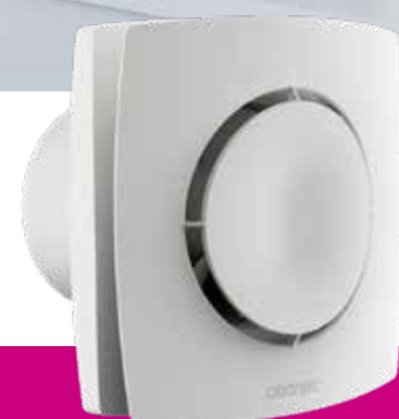
CURV FLASH Extraction ponctuelle

Le Curv Flash renouvelle rapidement et ponctuellement l'air de votre pièce en fonction du besoin. Il se déclenche manuellement ou automatiquement.