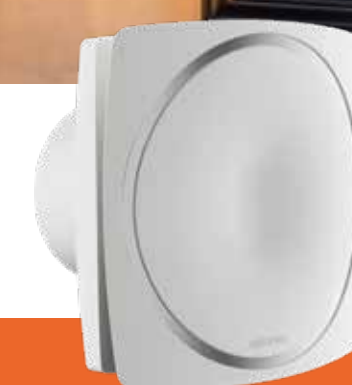
CURV GENIUS Extraction continue

Un design tendance, des performances assurées dans toutes les configurations, une consommation ultra basse et un fonctionnement silencieux : le Curv Genius ne fait pas de compromis et vous apporte sérénité et confort dans une pièce toujours saine.