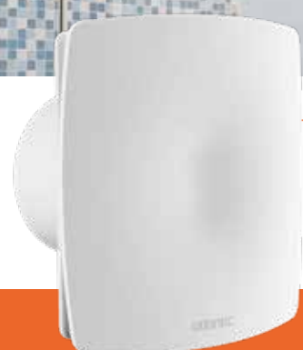
CURV CONFORT Extraction continue

Avec sa ligne épurée et discrète, le Curv Confort s'intègre parfaitement dans votre habitat. Son fonctionnement continu, silencieux et son ultra basse consommation vous apporteront sérénité et confort.